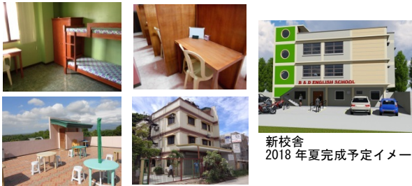
新校舎 2018年夏完成予定イメージ

校舎と宿舎が一体型のため、レッスン時に移動する必要がありません。食事や勉強、休憩でもお使いいただける共有スペースやラウンジもあります。